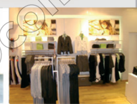
Prêt à porter