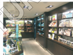
Equipement de maison