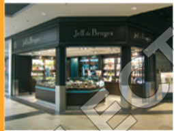
Equipement de la personne